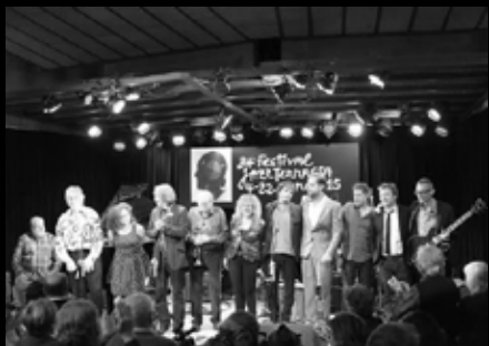
Barcelona Blues Reunion