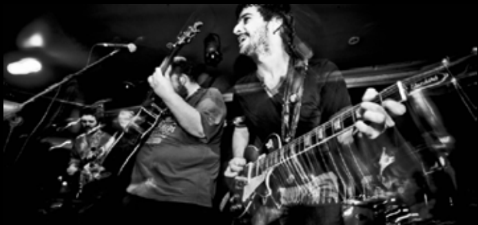
A Contra Blues