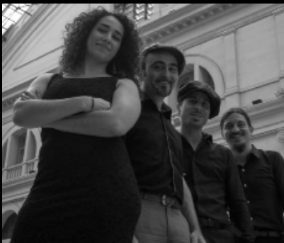
Sweet Martha & The Blues Workers